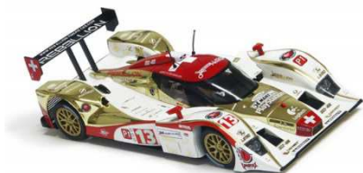
LOLA B09/60 - 10/60 - 11/80

1.1. I modelli Slot it omologati sono: Lola LMP e Audi R18 TDI