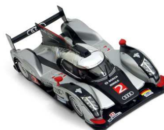
Audi R18 TDI

La tabella Box Stock è solo per riferimento