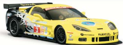
Corvette C6R GT2