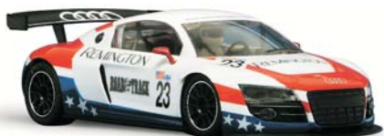
Audi R8 GT3