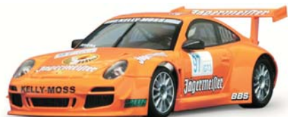
Porsche 997 GT3