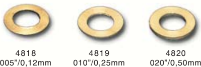
Pick-up guide spacer brass